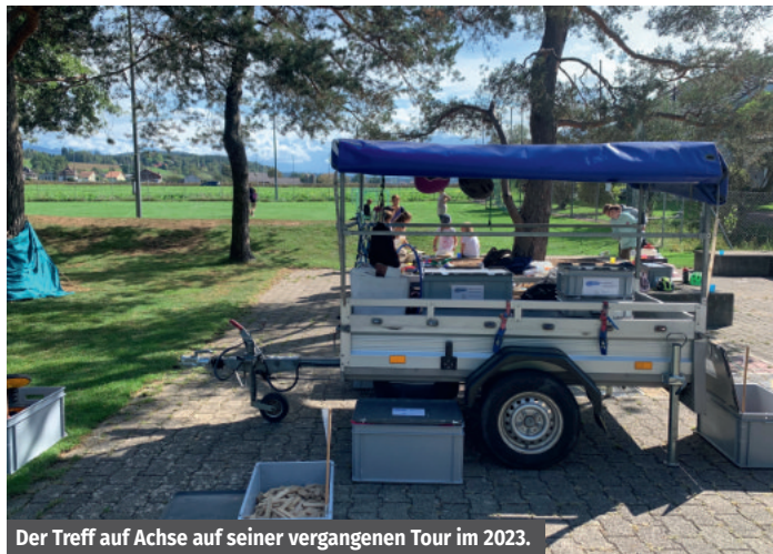
Der Treff auf Achse auf seiner vergangenen Tour im 2023.