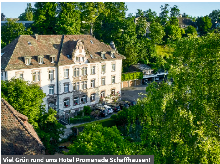
Viel Grün rund ums Hotel Promenade Schaffhausen!